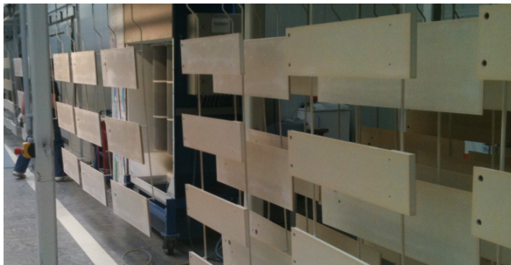
Die MDF-Anlagen sind speziell auf die Kundenbedürfnisse zugeschnitten.