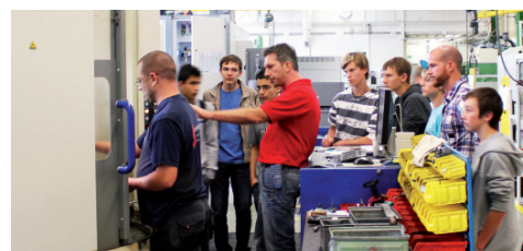
Schüler besichtigen die Fertigung bei Sprimag und erkunden sich über die Ausbildungsmöglichkeiten.

Eugen G. Leuze Verlag KG Karlst. 4 · D-88348 Bad Saulgau Tel. 07581/4801-0 · Fax -10 www.leuze-verlag.de